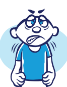
Nerviosismo o malestar