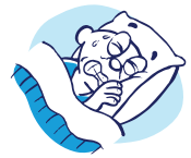
Pesadillas o llanto nocturno

Un valor de glucosa en la sangre por debajo de ____ mg/dl es demasiado bajo para mi hijo.