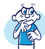
Irritabilidad o impaciencia