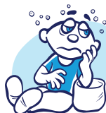
Debilidad o cansancio